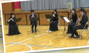
クインテット・カナ