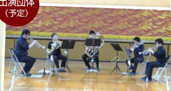
ブラスアンサンブル“GIFT”