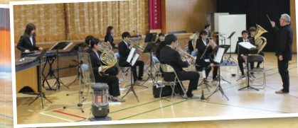
大阪芸術大学ブラスオーケストラ 他