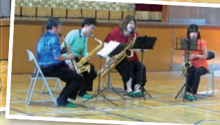
エスパルク・サクソフォン・アンサンブル