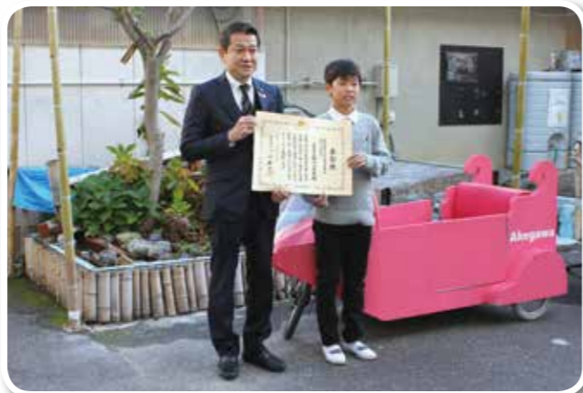
ピクトープを前に大松市長と児童代表(八尾市)