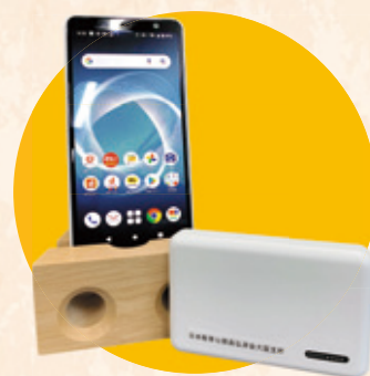
モバイルバッテリー (スマートフォンとその台は関係ありません)