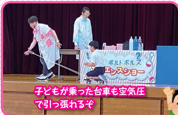
子どもが乗った台車も空気圧で引っ張れるぞ