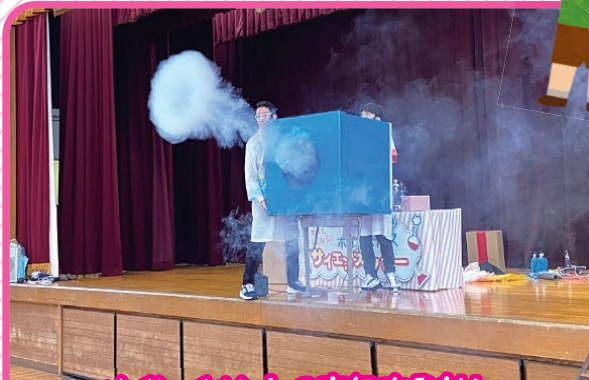
メインイベントの空気砲発射!