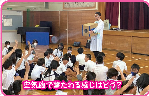
空気砲で撃たれる感じはどう?