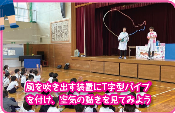
風を吹き出す装置にT字型パイプを付け、空気の動きを見てみよう