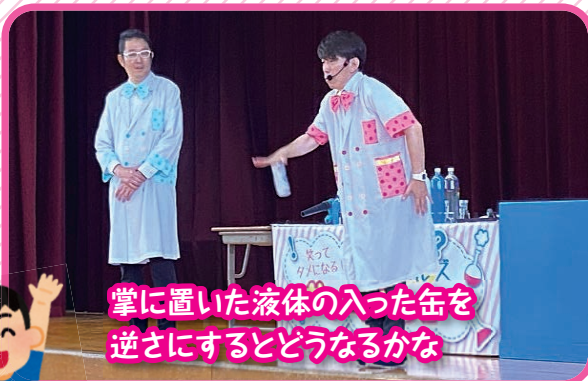
掌に置いた液体の入った缶を逆さにするとどうなるかな

写真は、7月19日に羽曳野市立西浦東小学校で行ったものです。今回も科学を楽しく体験できました。