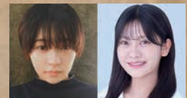
吉柳咲良 奥田いろは (乃木坂46)